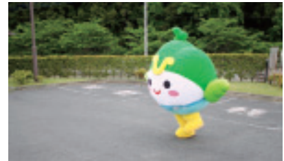
▲親水公園に到着すると、バラをみて突然走り出すひたまる

辰ノ口親水公園へー 常陸大宮市の花の「バラ」が咲く、辰ノ口親水公園に行ってきました。