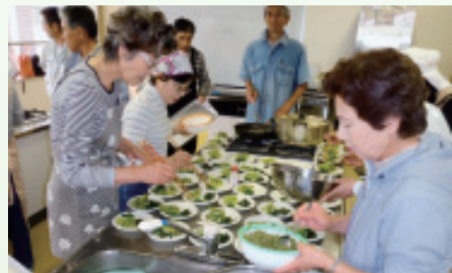
▲野草を使ったおひたし

参加者は、野草の名前や食べ方、野草が育つ環境や自然の大切さについて学び、有意義な時間を過ごしました。