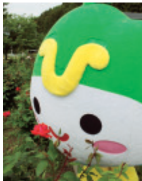
▲そっと匂いを嗅いでみると、とってもいい香りがしました

辰ノ口親水公園へー 常陸大宮市の花の「バラ」が咲く、辰ノ口親水公園に行ってきました。