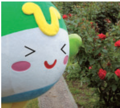
▲きれいなバラに羽根で触れようとしたらチクリととげが刺さりました