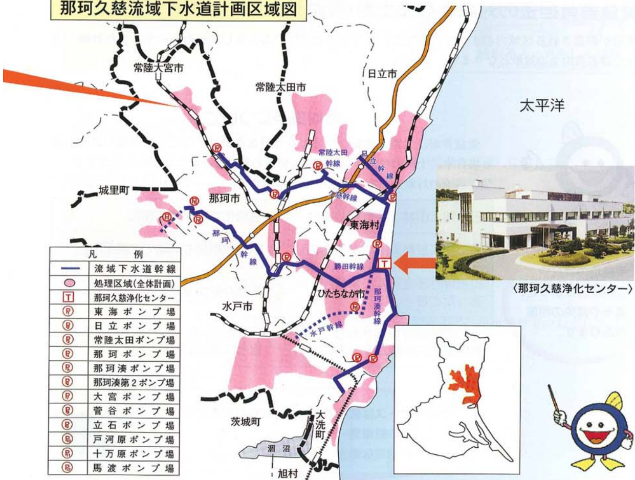
那珂久慈流域下水道計画区域図

当市の下水道是那珂久慈流域下水道に接続し、下水処理場を持たない当市外8市町村の下水と共に那珂久慈浄化センターで処理され浄化された水を太平洋へ放流しています。