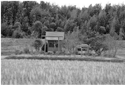
▲現在の土手稲荷神社

ある小貫地区は、久慈川が大きくS字状に湾曲する内側に位置するため、水害に見舞われやすい土地でした。そのため古くから各所に水神が祀られてきました。