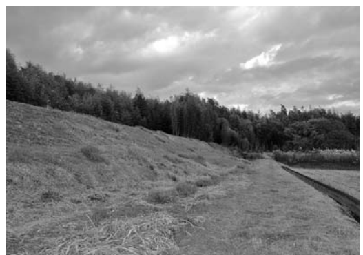
▲土手稲荷神社の旧社地と推定される場所。久慈川の堤防の北端

二月初午と八月の盂蘭盆、十一月十五日の例祭で、初午と例祭は日中に行われ、盂蘭盆は夕方から夜にかけて行われます。一年交代で回ってくる氏子惣代が祭りを取り仕切ることになっています。