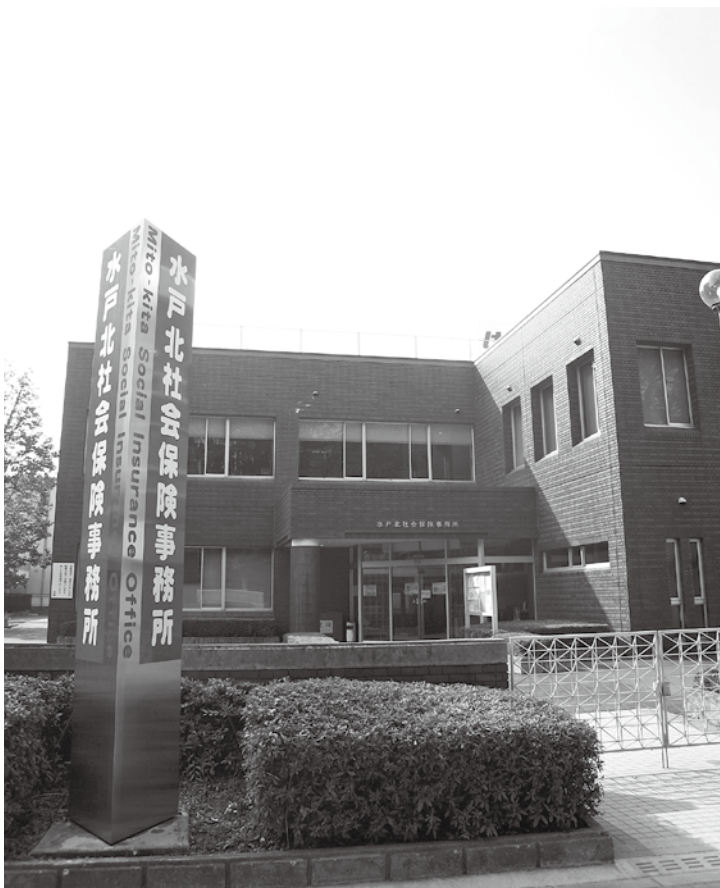
▲水戸市大町にある水戸北社会保険事務所

日本年金機構は、社会保険庁から公的年金の運営業務を引き継いで行うこととなります。しかし、公的年金制度は国の制度として、国がその財政や運営に責任を持つことについては、これまでと変わりません。国民の皆さんの信頼に応え、一層のサービス向上の実現を目指し、社会保険庁は組織・人員を一新し、「日本年金機構」として生まれ変わります。