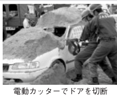
電動カッターでドアを切断