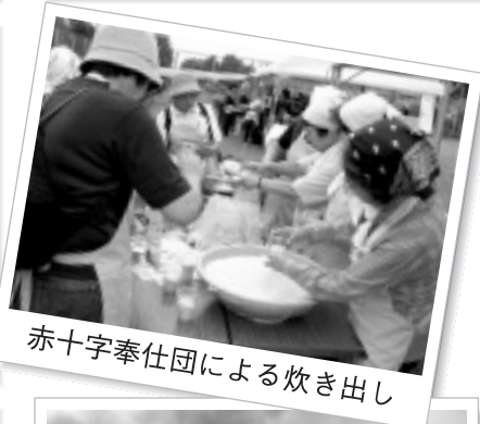
赤十字奉仕団による炊き出し