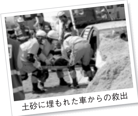
土砂に埋もれた車からの救出