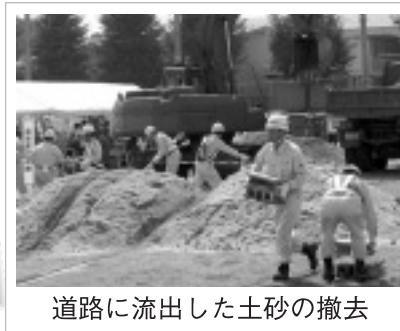
道路に流出した土砂の撤去