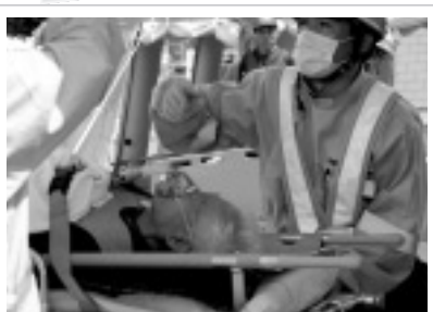
担架で運ばれる負傷者