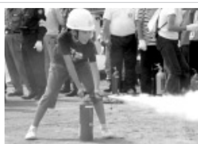
消火器による消火訓練