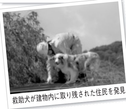
救助犬が建物内に取り残された住民を発見