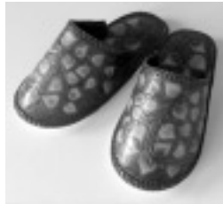
スリッパ 大瀧 順子