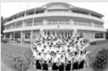
大場小学校の皆さん