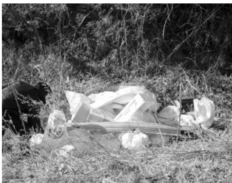
不法投棄は、犯罪です。