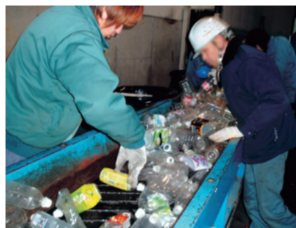
ふたの付いたペットボトル・ビンは、手作業で取っています。ふたは、はずして出してください。