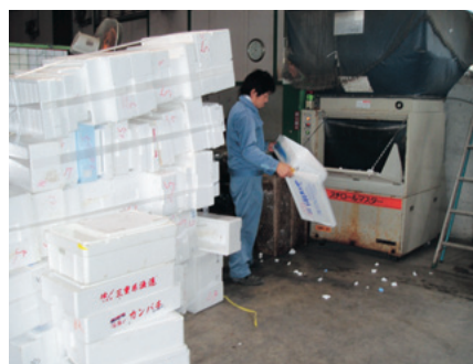
発泡スチロールのリサイクル作業