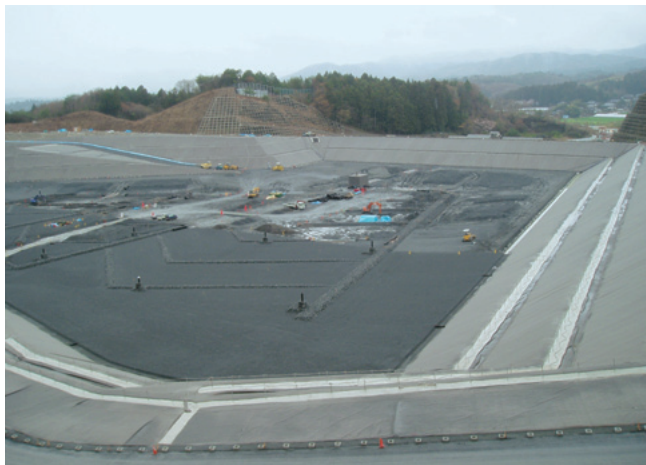
平成17年8月竣工に向け建設中のエコフロンティアかさま (最終処分場)

環境を守るためには、一人ひとりの取り組みが大切です。 豊かな自然を子どもたちに残していくには、これまでの大量消費・使い捨ての生活を見直し、環境にやさしい循環型の生活に変えていくことが必要です。 環境にやさしい生活は、ちょっとした心がけでできるものです。皆さんのご協力をお願いします。