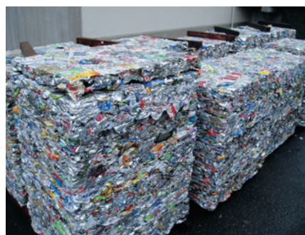
缶を圧縮処理してリサイクル