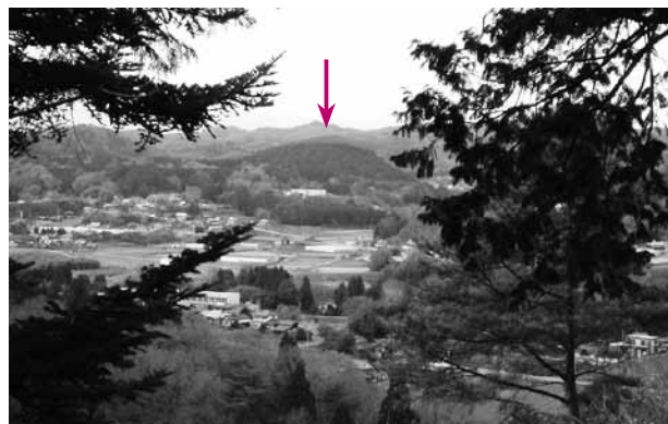
▲下伊勢畑要害城から見た長倉城