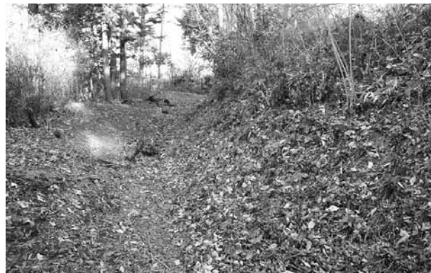
▲主郭北側の帯曲輪状遺構

遺構から検討すれば、防御は北側に厚く作られていることがわかります。つまり、北方の敵を想定していたと考えられます。