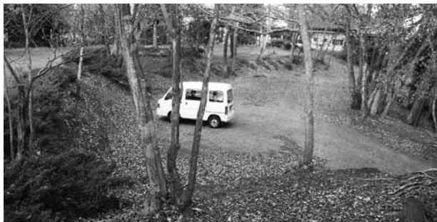
▲下伊勢畑要害城跡

城跡はほぼ東西に100m、南北に50～60m程の広さで、駐車場のある場所は城跡の南側に当たります。駐車場の北側に3mほど高い主郭があり、この北・東・南にかけて、一段低い帯曲輪状の遺構が主郭の周りを囲んでいます。