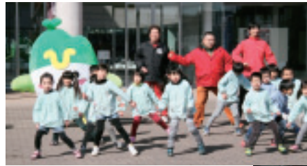
▲息の合ったダンスを披露したあきない組と園児たち

【いばキラTV】 http://www.ibakira.tv/archive/hajimarinohikari/