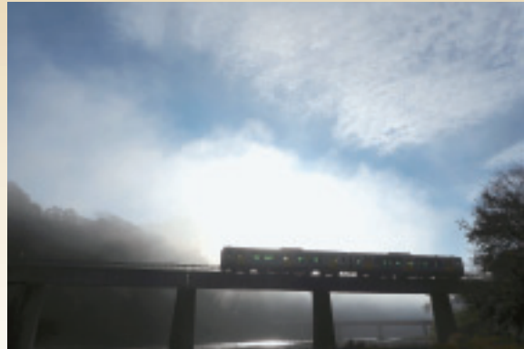
▲最優秀賞作品「川霧舞う朝」

市の素晴らしい自然や名所、祭りなどを被写体とした「常陸大宮市魅力発見フォトコンテスト」の入選作品が決定し、2月25日に表彰式が行われました。このコンテストは、写真を通じて市の新たな魅力を発見し、PRするために開催されていて、今年で8回目となります。