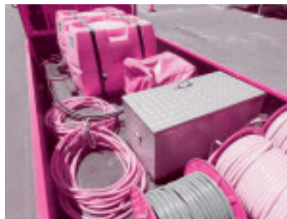
▲10月から翌年5月末までの積載品