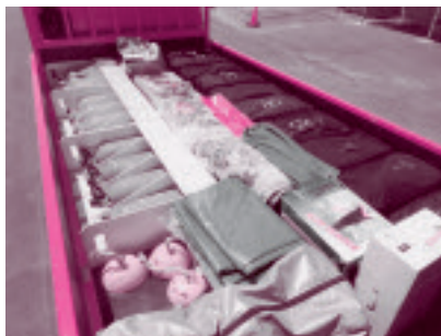
▲6月から9月末までの積載品