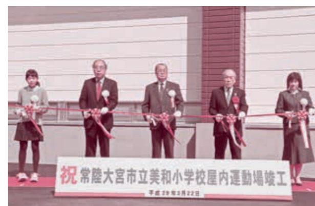
▲ 新体育館の前でテープカットを行いました

また、スポーツの振興や災害時の避難場所として、地域の重要な拠点としても期待されます。