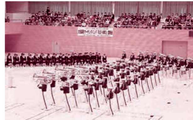
▲ 一糸乱れぬ動きに魅了されました

また大洗高校には、御前山中学校出身の部員1名も在籍していて、今後の活躍が期待されます。