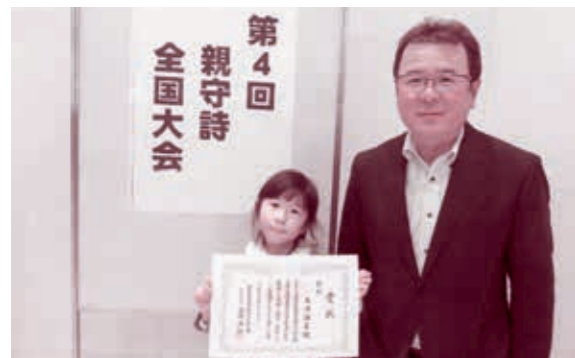
▲ 受賞した天津さん親子