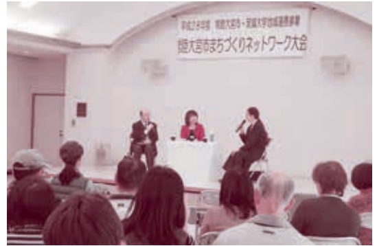
▲ 第1部の意見交換会