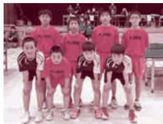
▲優勝した Over 常陸野