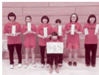
▲優勝した Over Limit