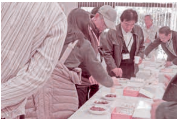
▲ 大館市特産品の試食会

また、友好都市を結んでいる大館市特産品の試食会も行われ、参加者からは「おいしい」と好評でした。食文化を知ることで、大館市をより身近に感じることができたようです。