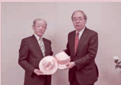
J A 常陸農業協同組合 通学帽・教材