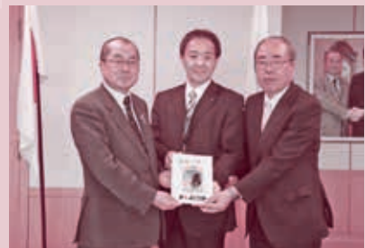
常陽銀行 防犯ブザー