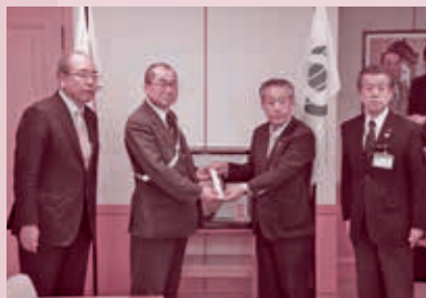
大宮地区交通安全協会 ランドセルカバー&タスキ