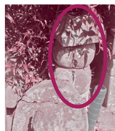
▲ 図5 宇留野向福寺五輪塔