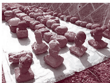
▲ 図4 小田野城麓五輪塔群