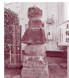
▲ 図7 常安寺大型五輪塔