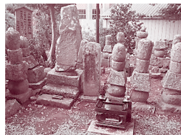
▲ 図6 常安寺五輪塔群