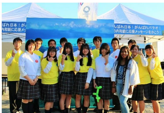
ボランティアとして協力してくれた 高校生の皆さん