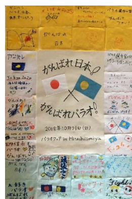
←ご来場いただいた皆さんに 書いていただいた 応援メッセージ（一部）