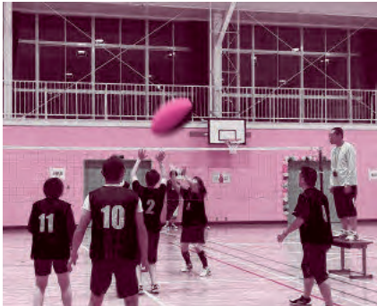
▲ヘルスパレーボール 山方地域の部優勝チーム

本市には、各種スポーツ関連団体がありますが、どの団体もスポーツに親しむ機会を作るため、創意工夫しながら様々なイベントを開催しています。教育委員会でも、より多くの市民の皆さんにスポーツに興味を持っていただけるよう事業を推進してまいります。