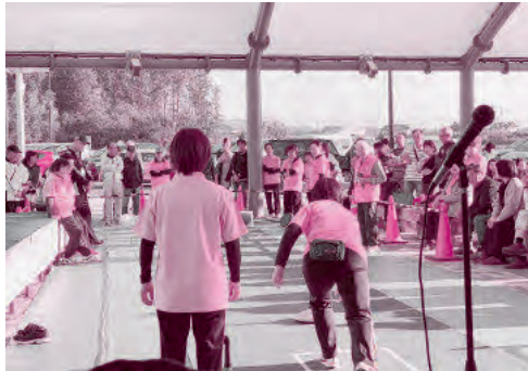
▲ユニカールの公開試合