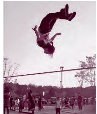
▲華麗なスラックライン演技

■問い合わせ■ 文化スポーツ課 文化・スポーツグループ ☎52-1111（内線342）