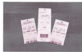
衣類などについていたタグ