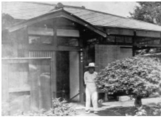
▲水戸市新莊の居宅前にて