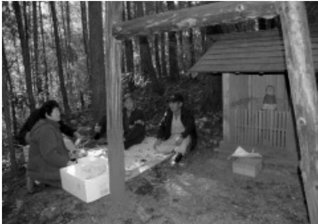
▶権現様のお祭りの様子