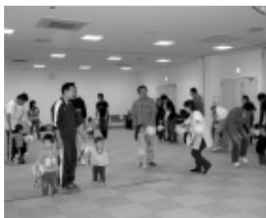
▲ミニ運動会の様子

子育て広場ってどんなひろば？ 子育て広場が総合保健福祉センター「かがやき」にオープンして1周年を迎え、多くの皆さんが利用しています。 子育て広場では、好きな時間に来て、子ども同士、親同士が自由に遊び、好きにおしゃべりし、互いに交流することができます。保育士も常時いるので、子育てについて悩んでいることや不安なことなど、気軽に相談でき、育児、子育ての情報なども提供してくれます。 料金は無料で、毎週火、水、木曜日の午前10時から午後3時（4月～9月は午後4時）まで、市内在住、または里帰り中で保育園や