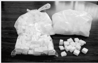
▲細かくした発泡スチロールをビニール袋に入れる。