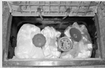
▲量水器ボックス内に隙間無く詰める。

■問い合わせ先 水道課 ☎(52)0427 各支所建設課 山方 ☎(57)6813 美和 ☎(58)3852 緒川 ☎(56)3994 御前山 ☎(55)2115