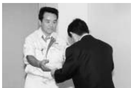
労働災害防止スローガン入賞者の表彰

今日、安全は事業所にとどまらず、社会的ニースとなっています。集いでは、企業視察、工業団地労働災害防止スローガン入賞者表彰、講演が行われ、参加者は、安心して安全・快適に働ける職場づくりに向け、決意を新たにしています。