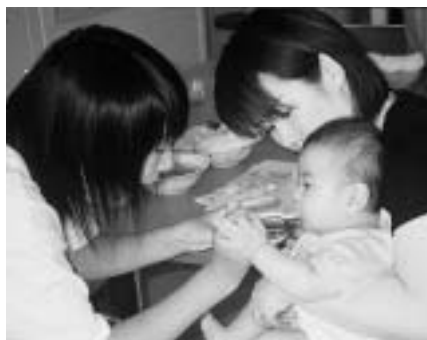
ふれあい体験学習

また、引き続き行われた思春期講座には、小瀬高校生と緒川中学校の3年生の希望者17人が参加し、6人の大学生