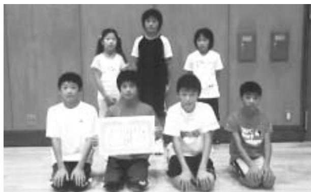
2チームを破り第1位になった八里スポーツ少年団

八里スポーツ少年団は、Dコートで水戸市と玉造町のチームを破り、第1位になりました。