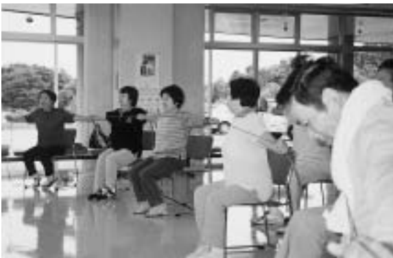
チューブ体操を行う参加者

参加者は、「実行できなくては正しい知識も意味がない」と熱心に質問し、生活習慣改善に向けて一歩前進したようでした。