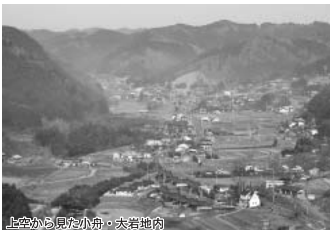
上空から見た小舟・大岩地内