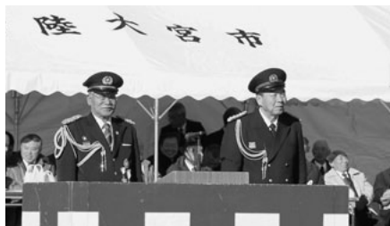
▲壇上の市長(右)と連合同長(左)