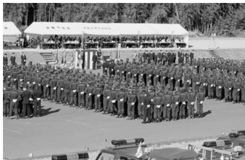
▲多くの来賓を迎えて式典が挙行