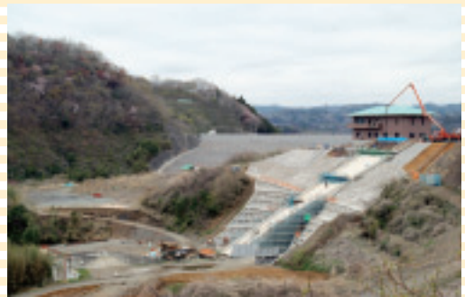
▲平成23年4月撮影 湛水開始前

運用が開始されるとダムの水は、常陸大宮市のほ か、城里町、水戸市、那珂市、茨城町、ひたちなか 市、大洗町、東海村の田畑で使用されます。