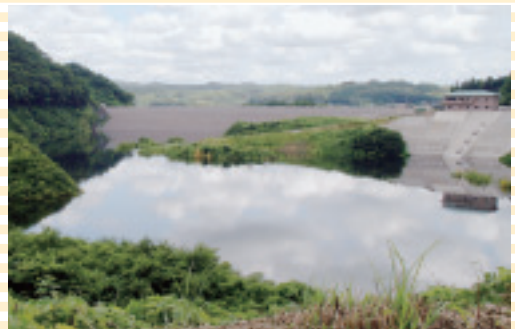
▲平成23年8月撮影 湛水中

※撮影日翌日の22日より水抜きが開始されたとの こと。試験湛水後の最終的な検査等が終わると水が 再び蓄えられ、四季折々の美しい風景が水面に映し 出されることでしょう。