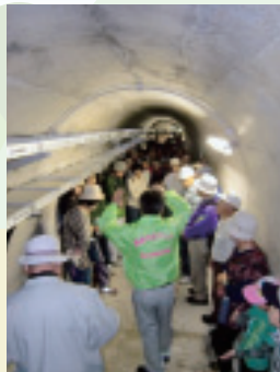
▲堤体内部地下50mにある監査廊(ダムの安全を確かめる通路)

平成23年中には、貯水してダムに問題がないかをチェックするための試験湛水が行われる予定です。