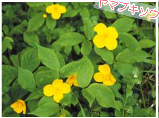
双子葉離弁花 ケシ科 クサノオウ属