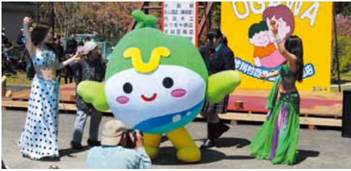
▲ダンスのセンスがあるかも??