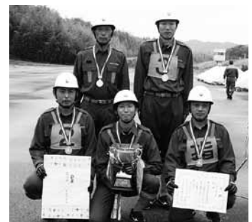
▲小型ポンプ操法の部で優勝した第14分団