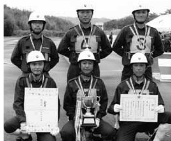
▲ポンプ車操法の部で優勝した第7分団

この大会は、消防団員の消防用機械器具操作の技術の向上と士気高揚を目的として行われているもので、競技は2部門で行われ、ポンプ車操法の部は山方地域の第7分団が、小型ポンプ操法の部は緒川地域の第14分団が優勝を飾りました。なお、優勝分団は、9月29日にひたちなか市で行われる県北地区大会に市の代表として出場します。