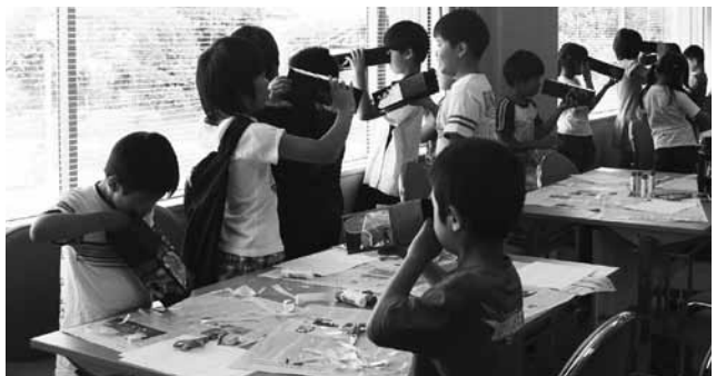
▲完成品をのぞいてみよう。どんな景色が見えるかな