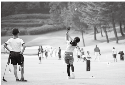
▲小学生スナッグゴルフ全国大会の東北地区予選の様子。（これに勝ち抜いた大宮小学校が全国大会出場を果たしました）

スポーツを通じて誰もが幸福で豊かな生活を営む権利。これは、平成23年度に施行されたスポーツ基本法の中でうたわれていることです。市教育委員会では、市民の皆さんに気軽にスポーツを楽しんでもらえる場として、今年10月に「スポーツクラブひたまる25」（以下、「ひたまる25」）を設立します。