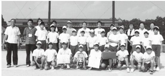
▲優勝したわんぱく子ども会の皆さん

※ティーボール…バッティングティーと呼ばれる台の上に置かれたボールをバットで打つゲーム