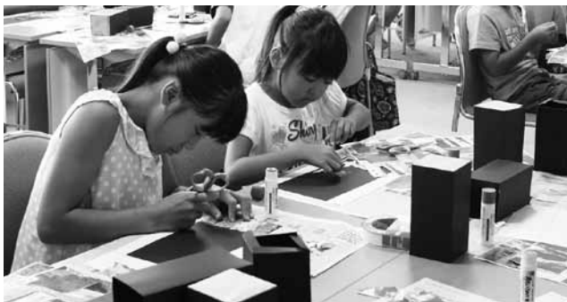
▲真剣な表情で作成する児童たち