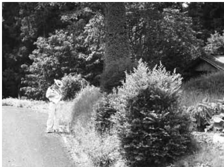
▲山方地域の遺跡の状況を確認中

文化財は地域の歴史や文化の成り立ちを理解する上で欠くことのできない貴重な歴史的財産で、将来の文化の向上・発展の基礎をなすものです。常陸大宮市には、県・市指定の文化財や遺跡など多くの文化財が所在しています。皆さんも機会があればぜひご覧ください。