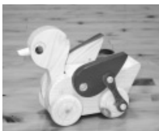
木のおもちゃ作り体験