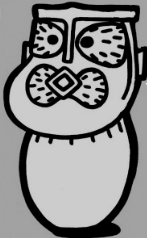
泉坂下遺跡出土 いずみ

このあたりの 弥生時代のことは さっぱりわからなくて ナゾだらけ なんですって。