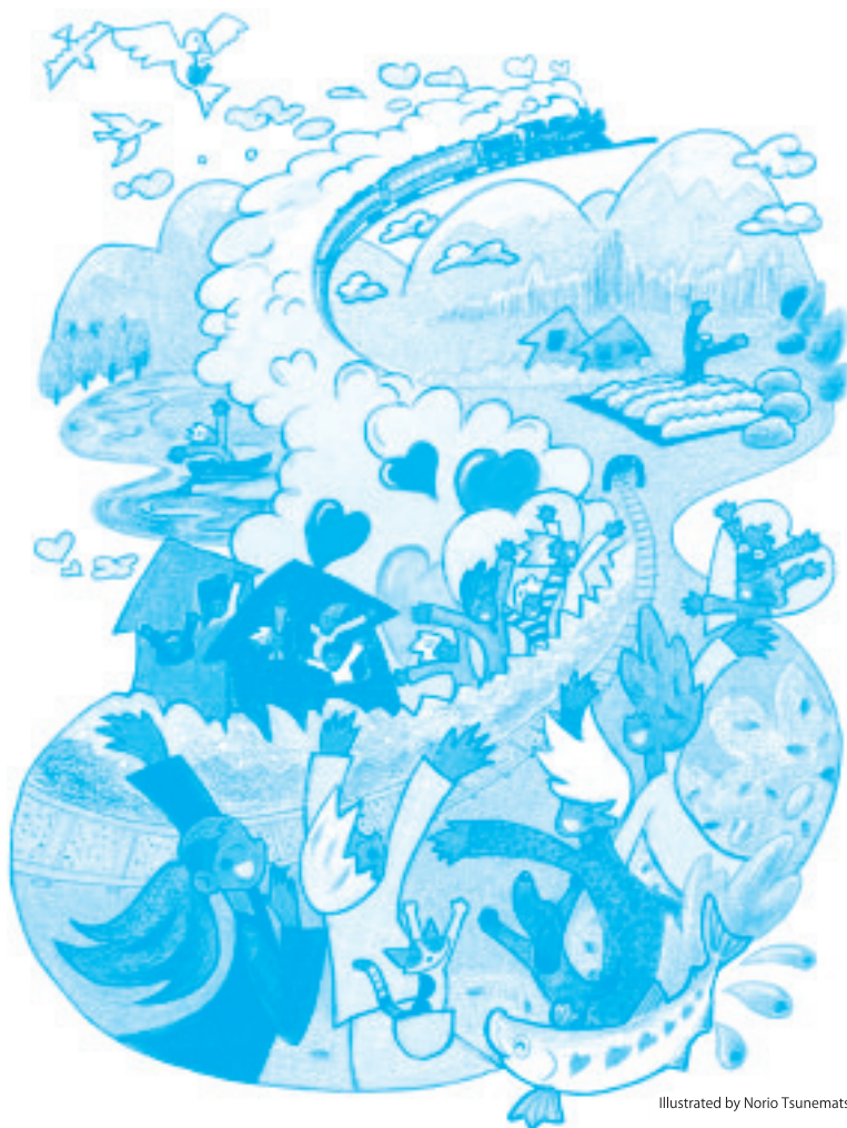
Illustrated by Norio Tsunematsu

SLが走るのは三日間。 一日二往復でチャンスは6回あります。 家の窓から、畑で仕事をしながら、 みんなを誘って、河原で遊びながら。 手を振る場所や時間は自由です。 水郡線SLを大歓迎しちやいませしょう♪