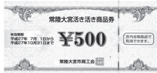
(青色:10枚/市内全取扱店で利用できます)