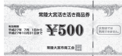
(赤色:14枚/大型では利用できません)

○内 容 20%プレミアム付【1セット12,000円分（1セットにつき500円券で24枚つづり）を10,000円】で販売します。