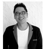
中西 保志 ♪最後の雨