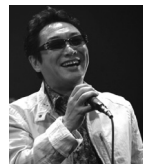
杉山 清貴 ♪さよならの オーシャン