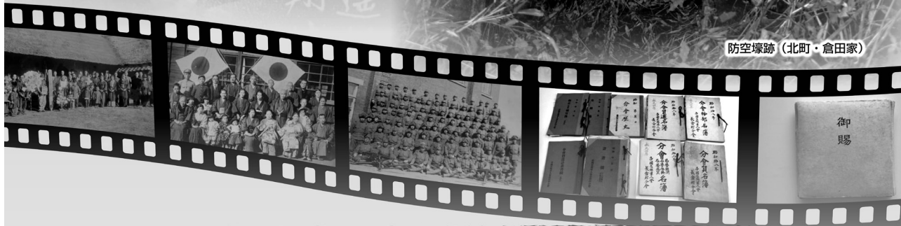
防空壕跡(北町・倉田家)

主催：常陸大宮市教育委員会 共催：公益財団法人上廣倫理財団 後援：文化庁 常陸大宮市 常陸大宮市文書館 TEL 0295-52-0571 FAX 0295-52-0851