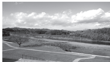
▲道の駅からの眺望