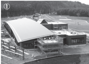
▲施設外観（東側から撮影）

「道の駅 常陸大宮」は、県内12番目の道の駅として今年3月25日にオープン予定です。皆さんに愛され、親しまれる道の駅になるよう、これからも準備を進めていきます。