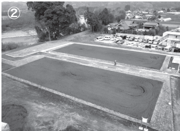
▲体験農園スペース