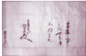
▲酒出義久官途状(寄託資料)

○文書館は誰でも予約なしで利用でき、閲覧は無料です。ただし公文書等の資料は公開判定のため数日かかります。また複写利用には実費がかかります。