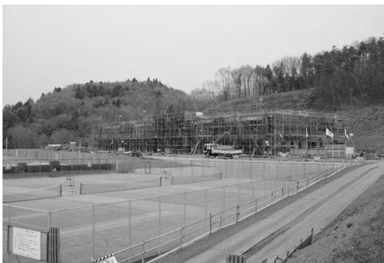
建設中の（仮称）御前山小学校