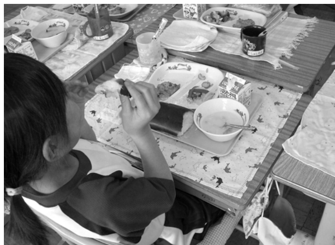
安心安全な学校給食

平成19年度7月に着工11月完成予定でしたが、亀裂が生じたため対策、工法等の調査検討が必要となり、設計変更、試験施工後本格的な工事に入ります。完成は平成20年7月頃の見込みです。