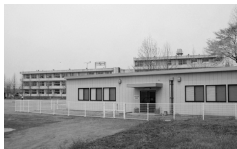
大宮西小の学童施設

放課後子ども教室推進事業は、市内19校のうち11の小学校で、学童保育については公立で3ヶ所、民間合わせて13ヶ所の施設で実施しています。今後、教育委