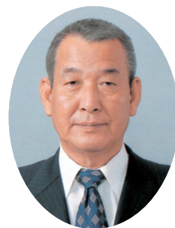
常陸大宮市議会議員 補欠選挙当選者