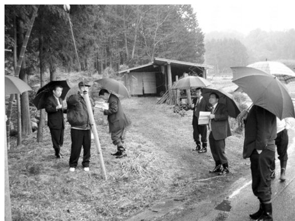
大賀小学校通学路