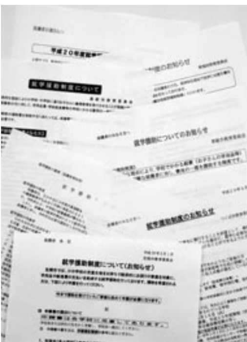
就学援助制度のチラシ

教育次長 認定基準を、各学校・民生委員等へ説明し、保護者への周知をお願いしました。更に、校長会で校内の共通理解を得るよう指示したところで