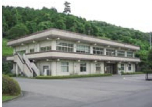
所在地 常陸大宮市小野 2090-1