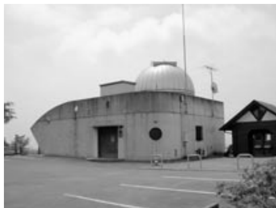
花立山天文台「美スター」