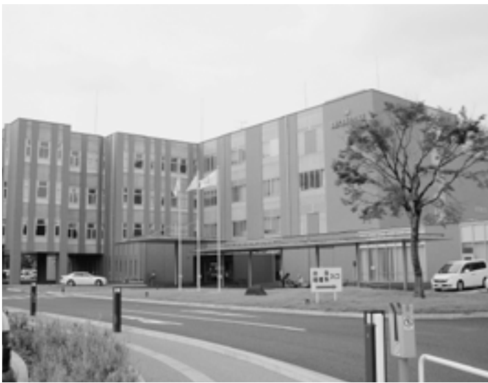
常陸大宮済生会病院

副市長は市内業者を利用するよう指示をしますが、随意契約において各職員はその認識が弱いと思われるが、その点を伺います。 隅々までそういう意識になつていくかどうかと言ふとなかなか難しい。しかし、徐々に浸透していくので、ご理解を賜りたいと思います。