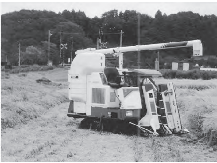
稲刈りのすむむ田