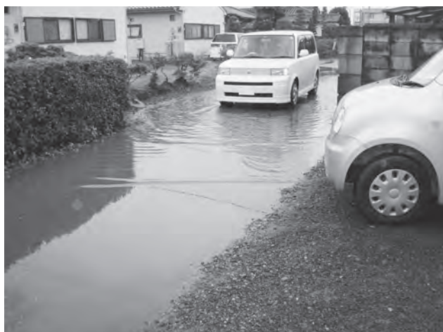
降雨時に冠水する道路（泉地内）