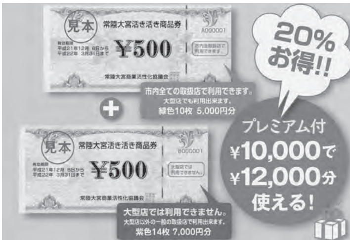
21年度発行のプレミアムつき商品券