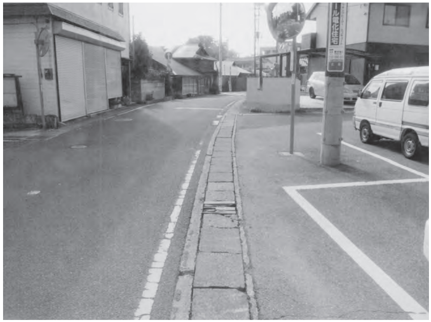
大宮コミュニティーセンター前のU字溝

す。しかも宅地の敷高が道路より高いところが多くなっている、宅地からの雨水が流入して冠水するとい