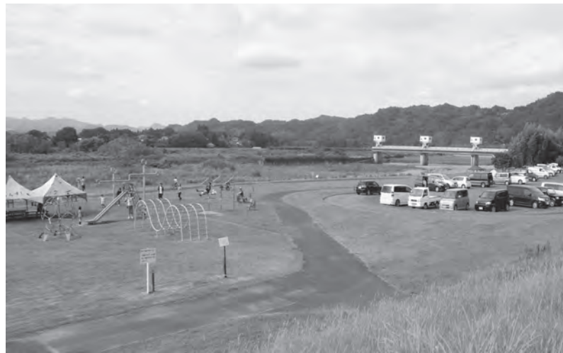
辰ノ口親水公園と辰ノ口堰

22年度以降は未買収箇所を買収、護岸工事、根固め工事等を計画的に施工して、早期完成に向け事業を進めていくと伺っています。