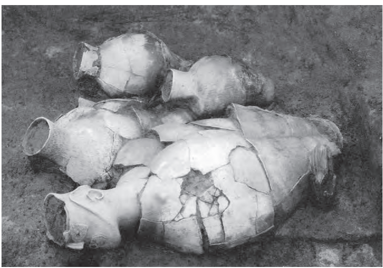
出土した人面付土器

俗資料館の設置について検討を協議します。しかし、現在分散している文化財の保管対策は、破損や保存不可能な状態になることを防ぐ意味で喫緊の