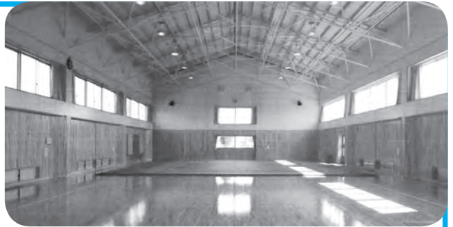
武道場内部のイメージ