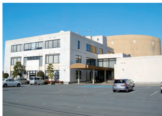
所在 東茨城郡城里町大字石塚1428-1 (コミュニティセンター城里3F)