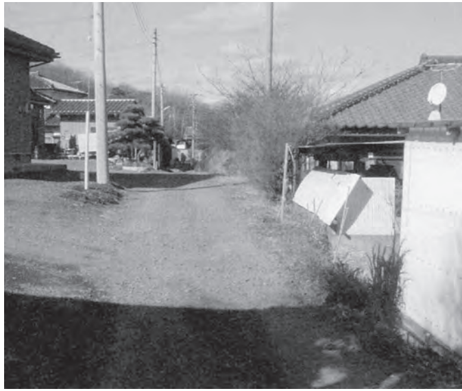
整備されていない砂利道

年5月の大改正から62年が経過しています。一つの事案に対し多くの相続人が発生し相続人の特定などの大変な努力が必要です。このような一部の調査業務等を職員OBなどの嘱託職員の採用により行うなど事務の