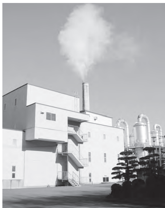
城北環境センター

務組合の見直しや行革と事務効率の観点から、すでに協議を行っていきます。城北地方広域事務組合の施設整備の借入金償還があと2年残っています。これまでの歴史的経緯を尊重し、脱会や統合の選択肢を視野に入れ今後双方で協議し、問題解消に努めたいと考えています。