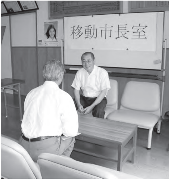
移動市長室（上岩瀬農村集落センター）

来年度以降も開催していきたいと思っており、実施場所や回数、方法等を再検討していきます。