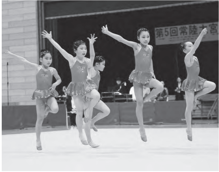
県内外のチームが出場する新体操競技

市内団体を優先した中で、市外団体の利用も増加傾向にあります。本年度、西部総合公園体育館は、県大会以上の大会で17回・合