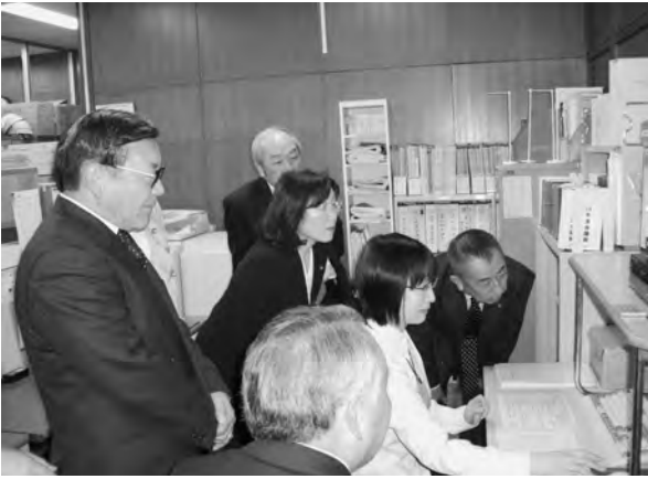
豊島区インターネット配信操作

開かれた議会の観点でのインターネットによる議会中継についてはライブ、録画等すでに実施している。