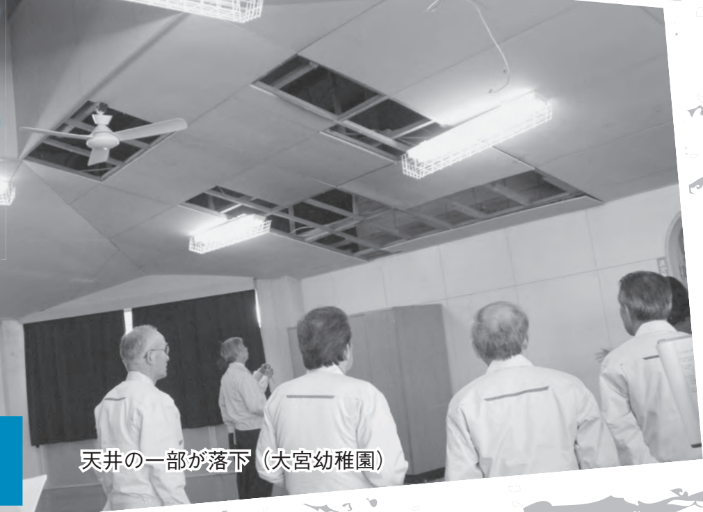
天井の一部が落下 (大宮幼稚園)