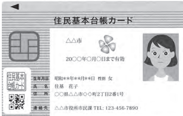
住民基本台帳カード

A 公営墓地の拡張の要望があり、新たな検討委員会を立ち上げ、現在の公営墓地の拡大も含めて対応します。