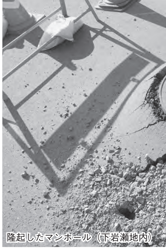
隆起したマンホール（下岩瀬地内）