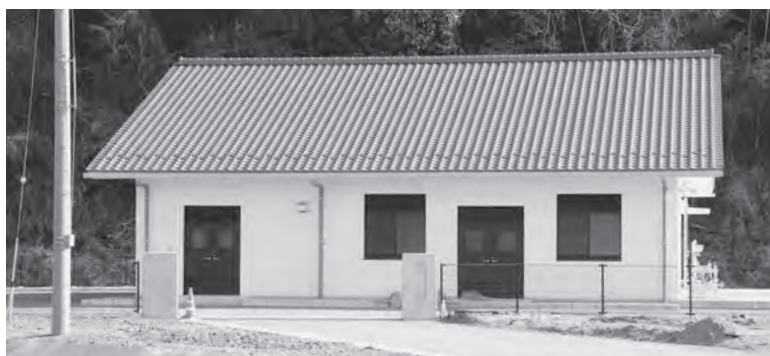
小瀬地区農業集落排水処理施設

A この事業は、今年度小瀬Ⅱ期地区が完成すると市全体の事業計画が完了し、14施設となります。今後は、供用率によって維持管理費等が大きく懸念されますので、接続加入者の促進を図っていきます。