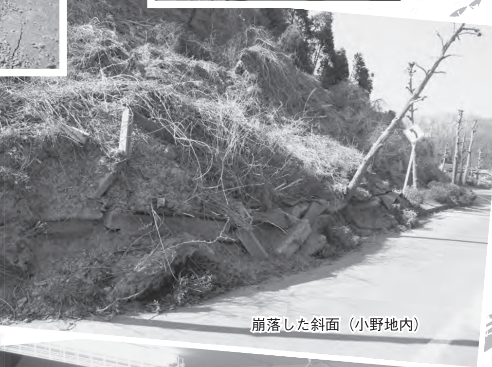
崩落した斜面 (小野地内)