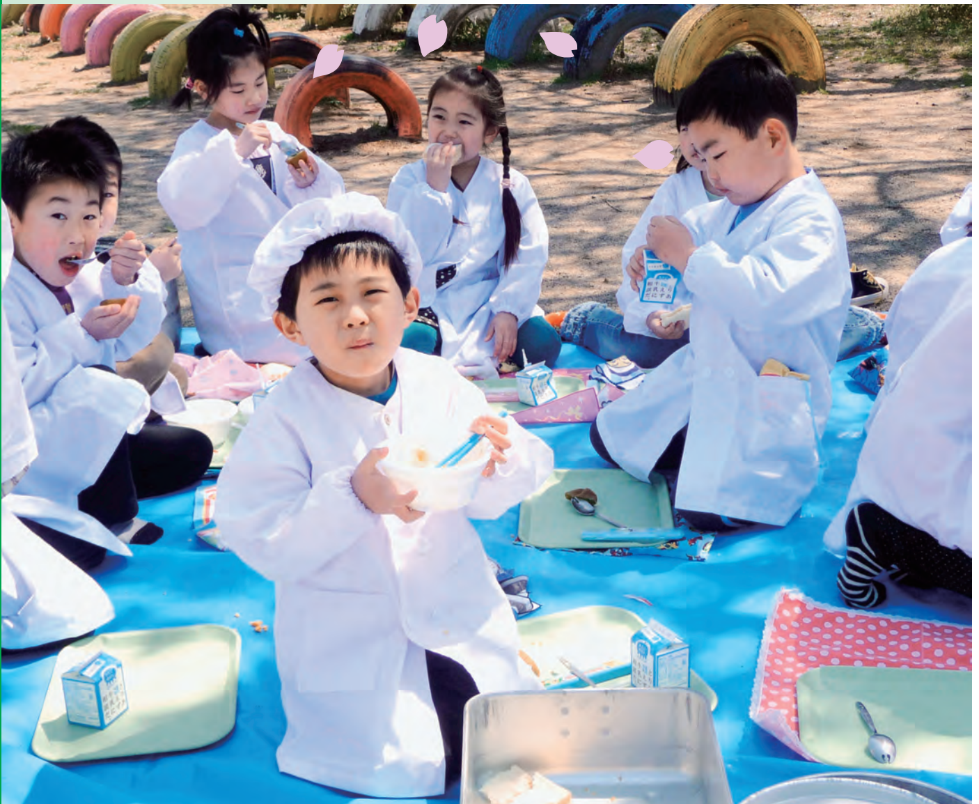
おいしかったね😊 桜のもとでお花見給食 (山方小学校)