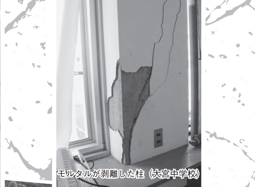
モルタルが剥離した柱 (大宮中学校)