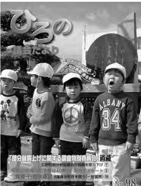
鳴りひびけ！ 広野駅 発車メロディー

議会改革の息吹の中、「読者の心を捉える広報紙」とは、分かり易いレイアウトや言葉を使うことに留まらず、議会の使命と機能の拡充を図る姿勢を示すことであると感じた。