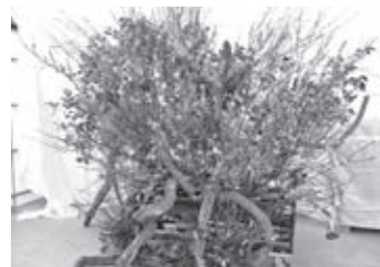
竣工式での枝物生けこみオブジェ

ハナモモ契約数量の拡大と労働時間の短縮、農業所得の確保と地域農業の活性化を目指すものとして、旧大場小学校跡地運動場の一部に施設が整備された。平成26年2月19日竣工。運営主体はJ A茨城みどり農業協同組合。総事業費4841万円（うち市補助金833万円）その概要を調査。