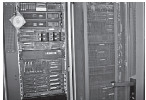
基幹業務システムサーバー