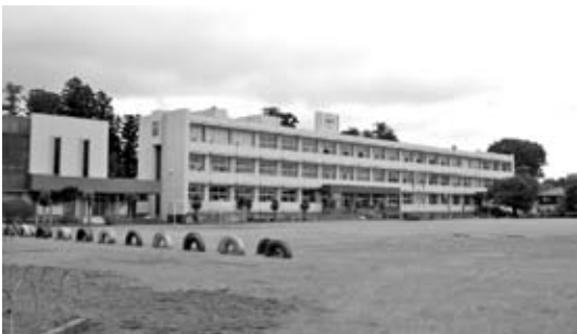
教育のための社会を目指して！

改革案では、教育委員会、事務局及び教師の力量がこれまで以上に求められています。したがって、教育委員会、関係者が更なる資質向上を図り、本市の教育や子供の教育の充実のために努めていくことが非常に大切であると考えます。