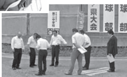
通学路の安全対策を調査 (H25.7.26)