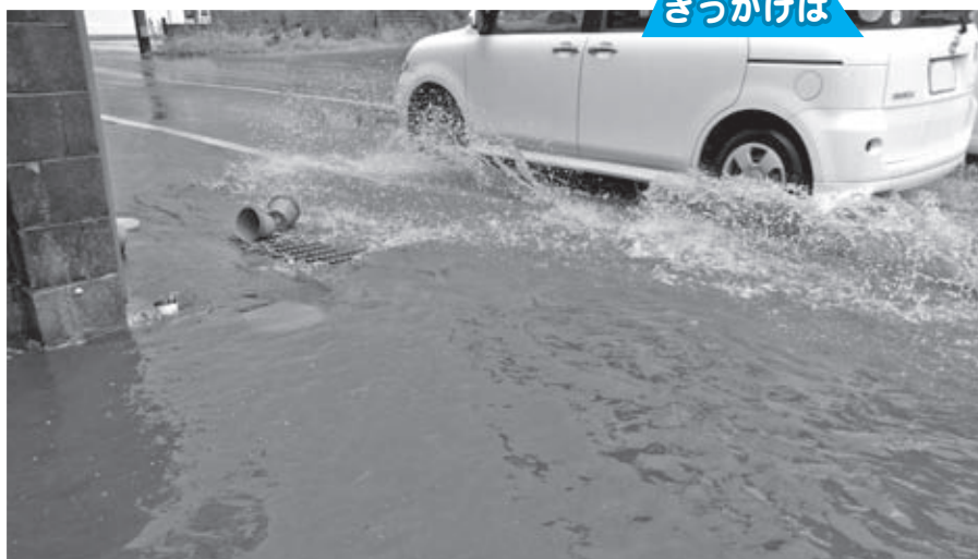
集中豪雨等では特に影響が……