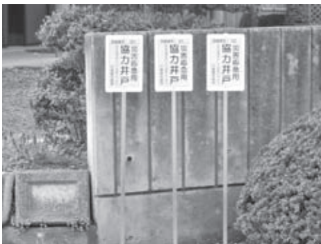
災害応急用協力井戸調査事業