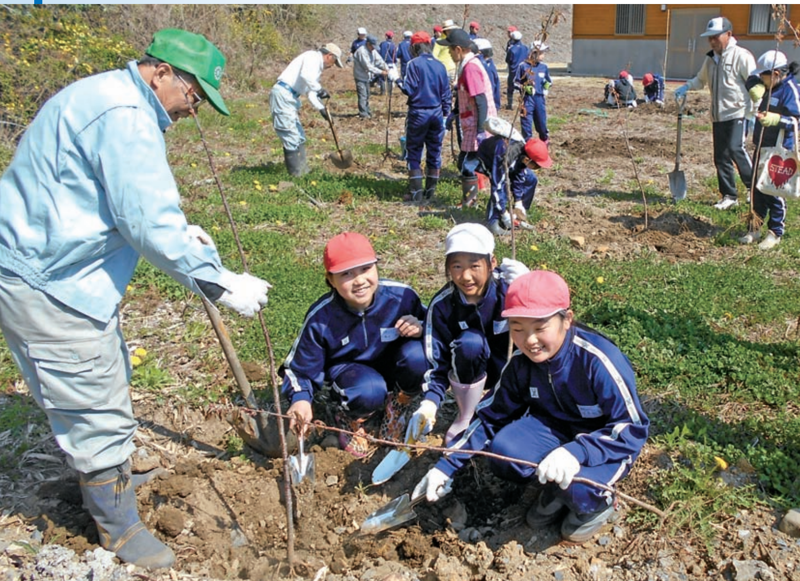
一緒に大きくなろうね。(御前山ダム公園 山桜の植樹)