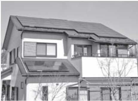
住宅用太陽光発電システム補助事業

各種計画及び事務事業の進捗状況について 地域防災計画・環境基本計画 浪漫文化街並みづくり事業・地方税電子申告システム構築事業・地域間交流事業・住宅用太陽光発電システム補助事業・災害応急用協力井戸調査事業