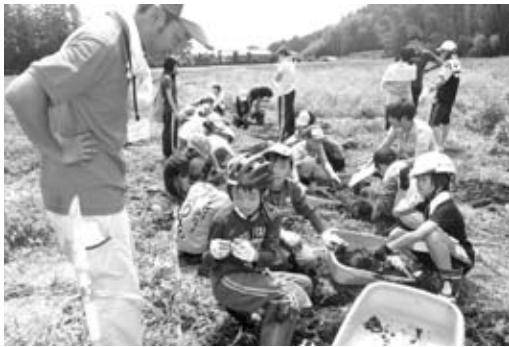
歴史を感じて…（泉坂下遺跡）

土常陸大宮市や郷土以外で も輝く人材となるように育 成しなければならぬと痛 感をしています。本年度は 市制施行・合併10周年とい う記念すべき年であるとし もに、今後の10周年、さら に、未来をどのようにして いくかの方向性を決定する 極めて重要な節目の年であ りますので、常陸大宮市に 生まれ育ち、郷土と祖国日 本に誇りを持つて新しい時 代を生きぬくことのできる 青少年を育成するために、 郷育立市の宣言を制定する 方向で検討する考えです。