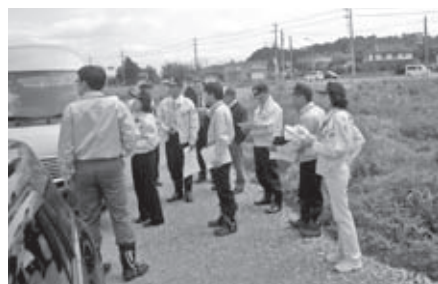
堤防付近からの景観予測は（H26.5.19）

(2) 収益部門の生産者・出荷者や市民も株を保有し、シティセールス気運の醸成を図るべき。約17億円の事業費に見合う市民への還元を目指して取り組む。