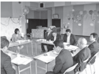
幼保の現状と適正配置を調査 (H25.5.15)