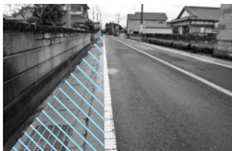
カラー舗装された通学路（那珂市）

安全対策の一つとして、交通量の多い通学路等においてガードレールが付けられない道路の路側帯にドラ