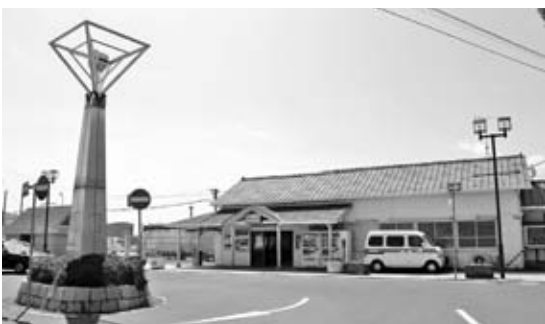
防犯や犯罪の抑止力に大きな成果（常陸大宮駅）

防犯カメラによる犯罪等の抑止効果は歴然であると感じるとともに有効な手立てと感じます。プライバイシー保護に配慮し、市民の了解のもと効果的な場所に設置を検討していきたいと考えます。