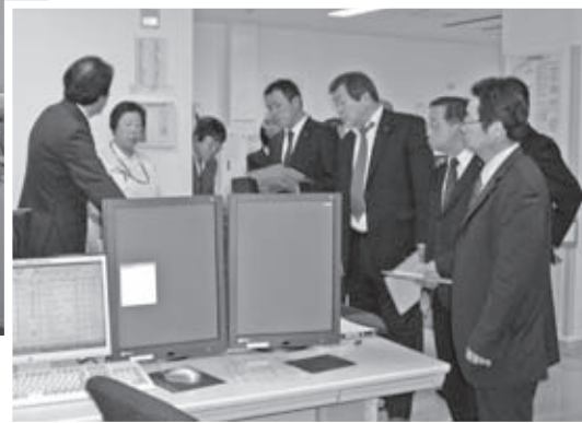
電子カルテの説明 (H26.4.21)