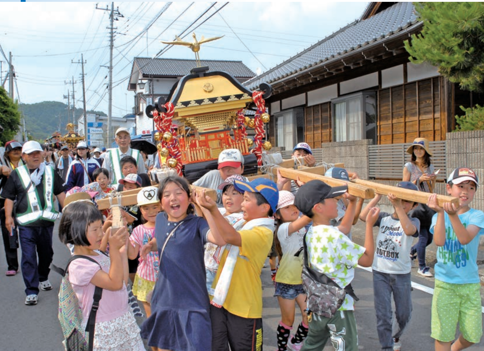
みんな元気で ワッショイ！ワッショイ！（緒川地区）