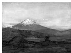
◀(五姓田義松「朝陽の富士」 1903～05年頃 当館蔵)