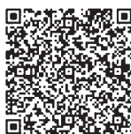
スマートフォン用