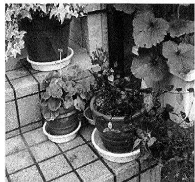
植木鉢の水受け皿