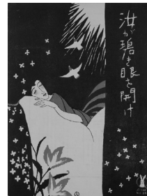
「(図版:竹久夢二「汝が碧き眼を開け」(セノオ楽譜 56番7版表紙) 昭和2年個人蔵)」