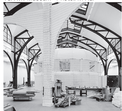
会場: 石沢地区空き店舗 ミハエル・ポイトラー 《Moby Dick》2015 the Hamburger Bahnhof Museum of Contemporary Art (Berlin)