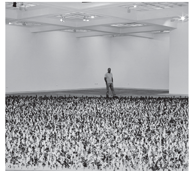
会場: 旧家と楽青少年の家 ザドック・ベン=デイヴィッド 《Blackfield》2010 Tel Aviv Museum