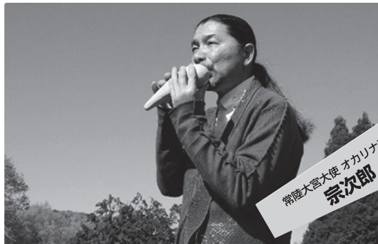
常陸大宮大使 オカリナ奏者 宗次郎