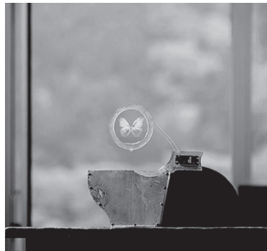
会場: 旧美和中学校 落合陽一 《コロイドディスプレイ》