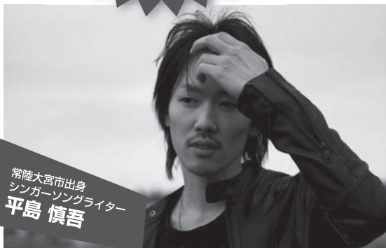
常陸大宮市出身 シンガーソングライター 平島 慎吾