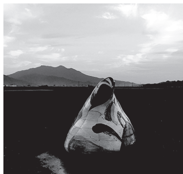
会場: 道の駅常陸大宮~かわプラザ~ 塩谷良太 《物腰》2015