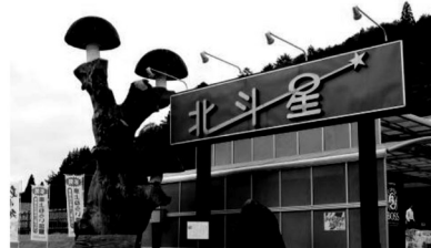
▲目印は大きないたいけ