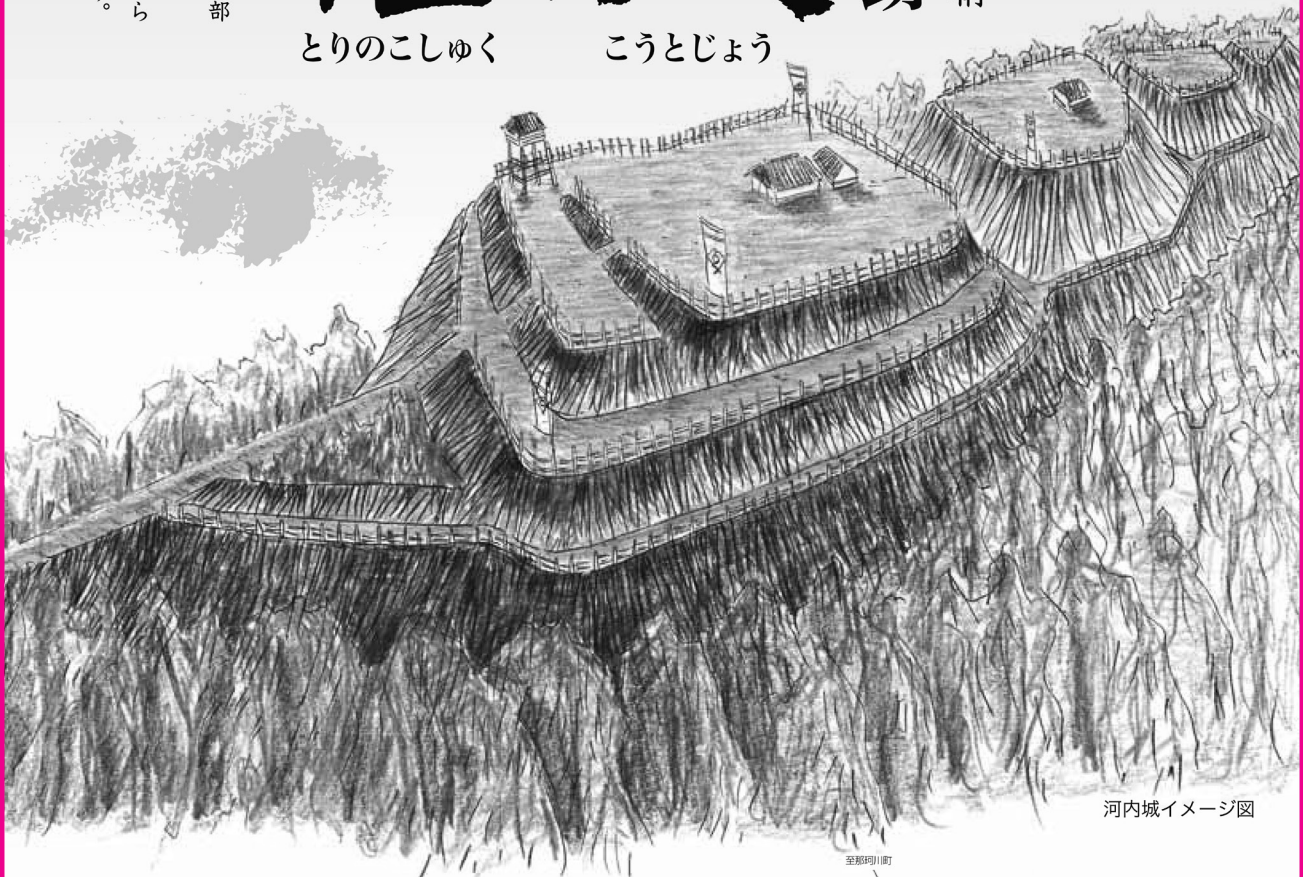
河内城イメージ図