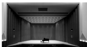
反響板設置の舞台