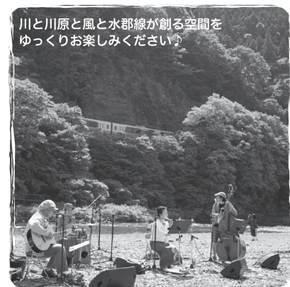
川と川原と風と水郡線が創る空間を ゆっくりお楽しみください♪