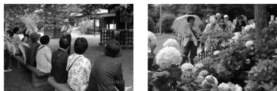
【昨年度の様子】水戸の杜と歴所を歩こう